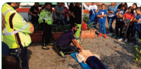
Settimana della sicurezza