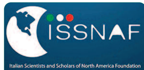
Bando Cni - Isnaff 2016