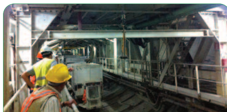
Visite in cantiere